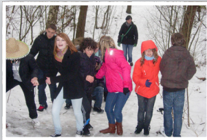
Förderung des Schüleraustausches/Spanien & Frankreich