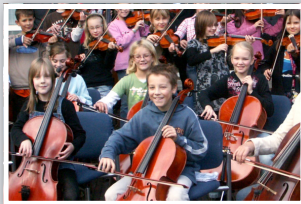
Unterstützung der Streicherklassen