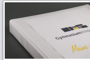
Informationsmappen für neue Jahrgänge