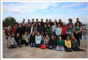
Förderung des Schüleraustausches/Ungarn