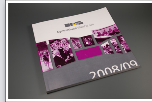
Finanzielle Absicherung der Schulchronik