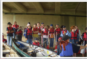
Unterstützung von Klassenfahrten